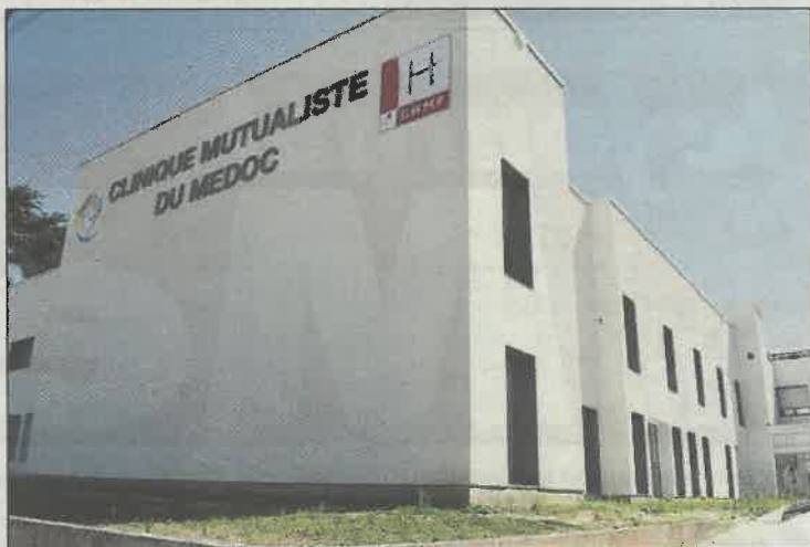
L'ensemble des personnels de la clinique et ses sous-traitants a été testé.

Il y a environ dix jours, explique Yann Pilatre, directeur du Pavillon de la mutualité, un ou une patient-e (il ne sait plus) est arrivé-e aux urgences de la clinique de Lesparre-Médoc « avec des symptômes » du coronavirus Covid-19. Le test de dépistage PCR (par le nez) s'est avéré négatif. Cette personne a été hospitalisée en gériatrie, à la suite de quoi un deuxième test PCR a été effectué pour se révéler lui aussi négatif. « Finalement, c'était un patient Covid qui n'était pas sensible au test », analyse Yann Pilatre. Un infirmier des urgences a été infecté, testé positif au Covid-19 le 17 juillet, « avec des symptômes ». Résultat, explique Yann Pilatre, « j'ai souhaité qu'on procède à des tests rapides ». Il s'agit de tests sérologiques : du sang est prélevé par piqûre au bout du doigt. Ces tests ne sont pas d'une fiabilité excellente mais ils donnent une tendance et s'inscrivent dans la démarche de « précaution » de la clinique mutualiste. L'ensemble du personnel soignant qui a été en contact direct avec l'infirmier ainsi que le patient infecté a été testé. Soit une vingtaine de tests, parmi lesquels quatre ont réagi positivement : chez trois aides-soignantes et un kinésithérapeute.