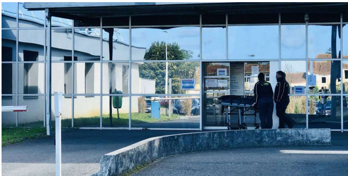
La clinique de Lesparre dispose d'un service des urgences qui joue un rôle important l'été.

Après la détection de cinq cas de Covid-19 la semaine dernière, l'établissement a fait tester l'ensemble de son personnel et des sous-traitants. Les 350 tests sont revenus négatifs.