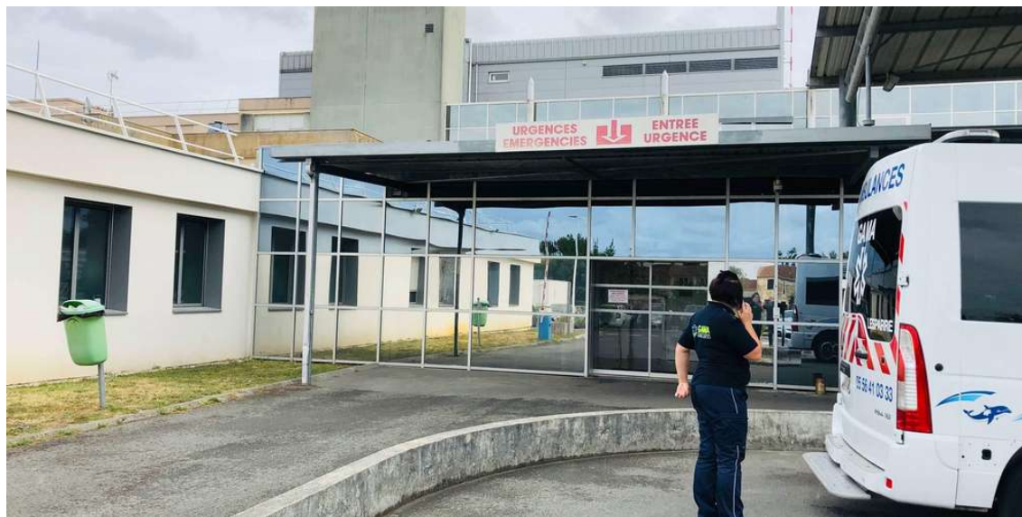
La clinique de Lesparre teste tout son personnel jusqu'à mercredi

La clinique mutualiste de Lesparre teste en ce moment l'ensemble personnel. L'opération devrait se dérouler jusqu'à mercredi. L'établissement reste ouvert au public